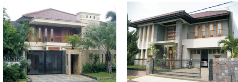
Gambar 1 (atas kiri). Rumah tinggal dengan preferensi paling tinggi pada survei tahun 2005. Gambar 2 (atas kanan). Rumah tinggal dengan preferensi paling tinggi pada survei tahun 2006.

tersebut memiliki elemen fasad yang diulang (bukaan dinding dengan dimensi sama dan diajar). Repetisi elemen fasad membentuk ritme yang menciptakan kesan keteraturan dan membuat fasad terlihat serasi. Dua rumah tersebut juga memiliki fokus, rumah pada gambar 1 memiliki dinding vertikal di samping entrance (seperti cerobong asap) dan rumah pada gambar 2 memiliki kolom vertikal dan void pada bagian entrance bangunan. Kehadiran fokus mempermudah orientasi, memperjelas hirarki antar elemen dan meningkatkan legibility fasad, yang selanjutnya meningkatkan preferensi.